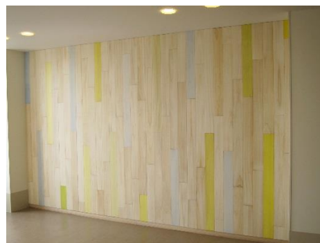
「ぬくもりと光の壁」 塗装協力

2016 年度に埼玉県春日部市新設の医療センターにおいて、ホスピタルアートの一環として塗装表現の提案と制作を行うなど公共空間への展開や、都市設計においても重要な役割として応用することができます。また、漆芸という地域産業を担ってきた技術を研究することで、地場を生かした産学連携事業に展開できます。