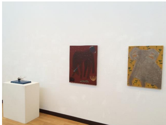
2015年展覧会場での展示