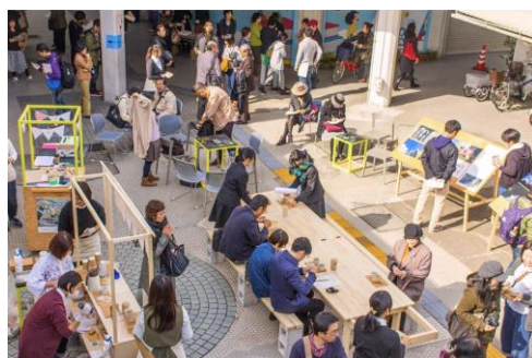
図2：プログラム事例もとまちカフェ Vol.2 (2016.11.12)